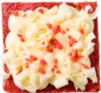
BLONDIE RED VELVET Zoete roomkaas - witte chocoladekrullen 4.00