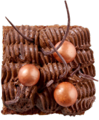
BROWNIE CHOCOLOCO Chocolademousse - koperen chocoparels 4.00