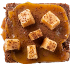
BROWNIE FUDGE ZEEZOUT Butterscotch karamel - vanillefudge 4.00