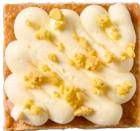
BLONDIE MANGO Mangocrème - mangocrunch 4.00