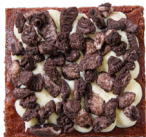
BROWNIE OREO Witte chocolade - Oreo-crumble 4.00