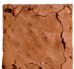
NATUREL Brownie of blondie Altijd lekker! 3.70